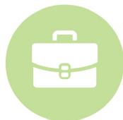
Cadre supérieur de santé / cadre de santé