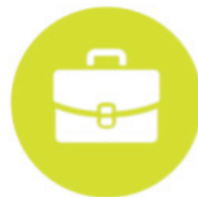
Cadre de santé