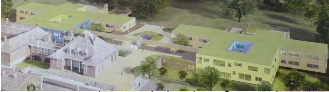
Site hospitalier de Sainte-Geneviève-des-Bois